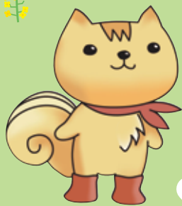
京都市食の安全安心啓発キャラクター "おあがりス"